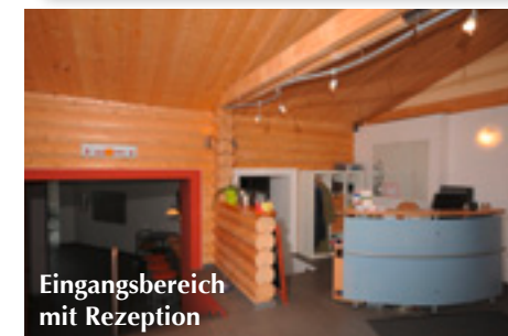
Eingangsbereich mit Rezeption