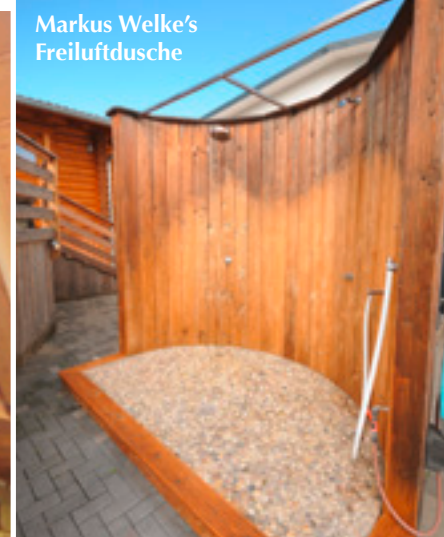
Markus Welke's Freiluftdusche