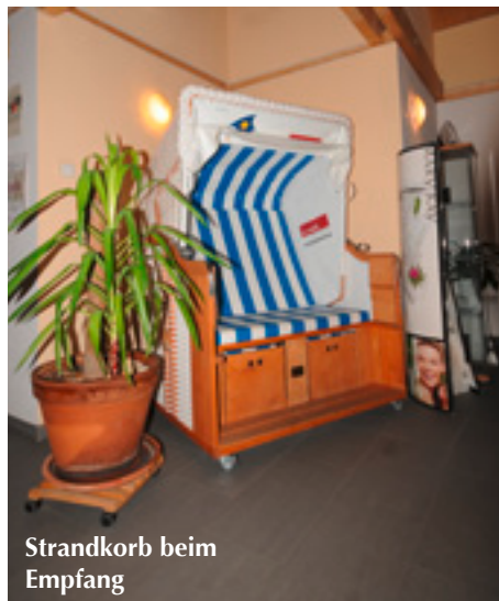
Strandkorb beim Empfang