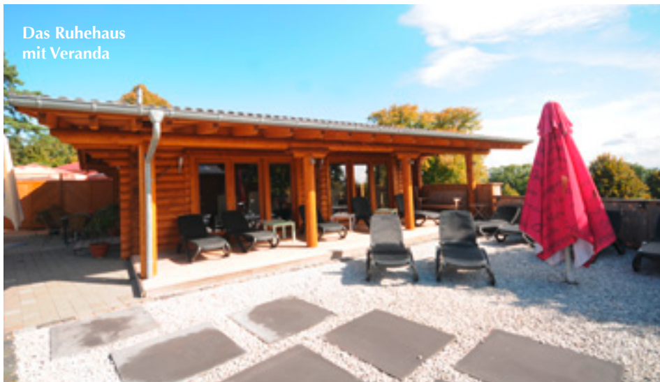
Das Ruhehaus mit Veranda

Abendveranstaltungen im Freien abgehalten werden. Doch noch eine wichtige Besonderheit weist die Anlage auf. Der Familienbetrieb bietet im Café-Restaurant Köstlichkeiten aus der hauseigenen Küche. So kann er in der Vitalis-Saunalandschaft ohne zeitliche Befristung und zum Mini-