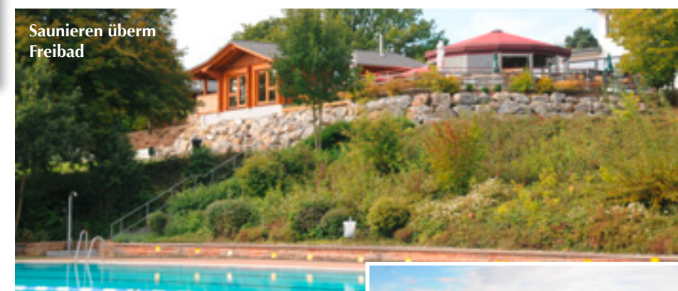
Saunieren überm Freibad

wechselnde Feuchtigkeit dem Holz nichts anhat, kann man nur bewundern. Innerhalb einer Stunde wird die Außensauna morgens auf Temperatur gebracht. Dies geschieht mit einer 90 Kilowatt-Gasheizung. Im zeitlichen Rhythmus folgen dann die professionellen Aufgüsse und die Hütte dampft. In der Sauna können die Saunagäste das Ritual mit einem herrlichen Ausblick durch die Panoramafenster doppelt genießen.