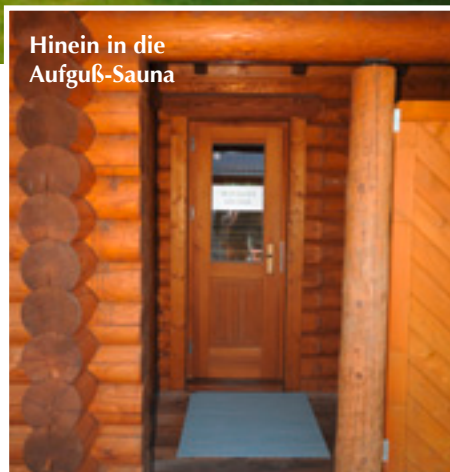
Hinein in die Aufuß-Sauna

Abendveranstaltungen im Freien abgehalten werden. Doch noch eine wichtige Besonderheit weist die Anlage auf. Der Familienbetrieb bietet im Café-Restaurant Köstlichkeiten aus der hauseigenen Küche. So kann er in der Vitalis-Saunalandschaft ohne zeitliche Befristung und zum Mini-